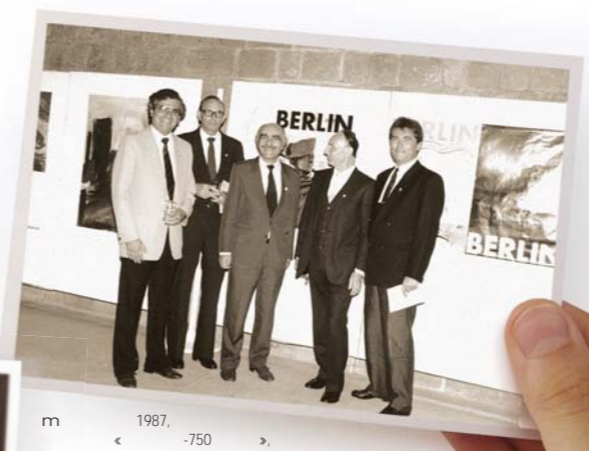
1987, -750 Oktober 1987, Veranstaltung „750 Jahre Berlin“, Famagusta Tor