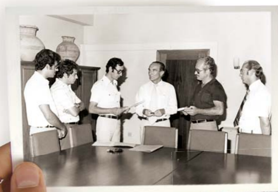
1980, «Erfrischungskurs» Carl Duisberg Gesellschaft September 1980, Zeremonie zur Verleihung der Urkunde für den „Erfrischungskurs“ der Carl Duisberg Gesellschaft an Stipendiaten des Vereins