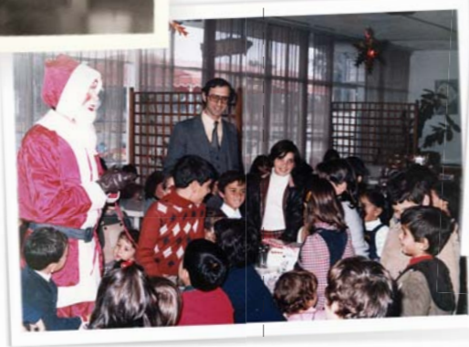
1981, Dezember 1981, Weihnachtsfeier für die Kinder der Vereinsmitglieder, in „Monastiraki“