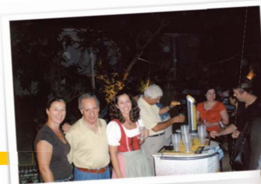
μ «Oktoberfest light», «Oktoberfest light», Nikosia

In den 90er Jahren organisierte der Verein eine Tagung zum Thema „Umwelt“ und wirkte bei der Eröffnung des Aufforstungsprogramms auf ganz Zypern mit.