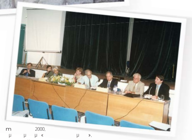
2000, Oktober 2000, Veranstaltung zum Thema „Studieren in Deutschland“, Universität Zypern