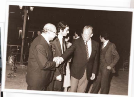
1982, Willy Brandt, Januar 1982, Bundeskanzler Willy Brandt zu Gast, Taverna „Shistris“