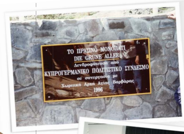
1996, « Die grüne Allee“ in Zusammenarbeit mit der Gemeindeverwaltung des Dorfes Agia Barbara